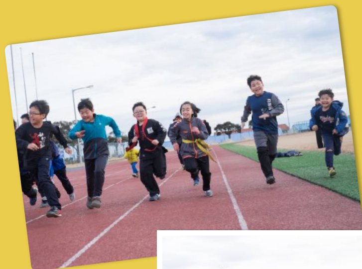
UNE COURSE POUR DÉVELOPPER LA RAPIDITÉ ET L'ENDURANCE